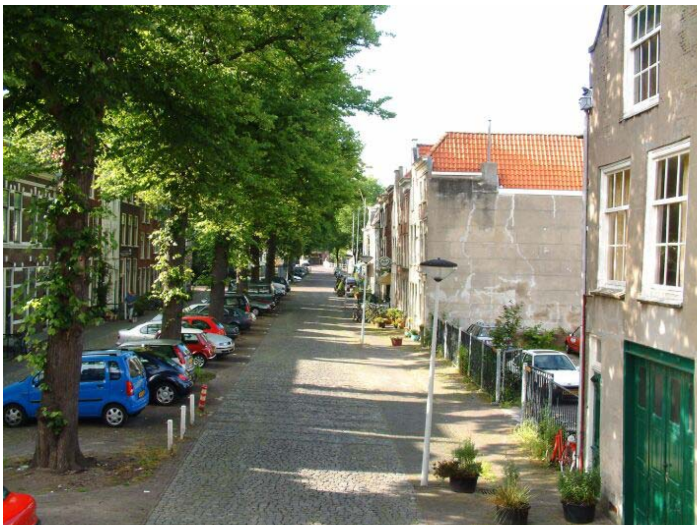
Het gat van de Garenmarkt.