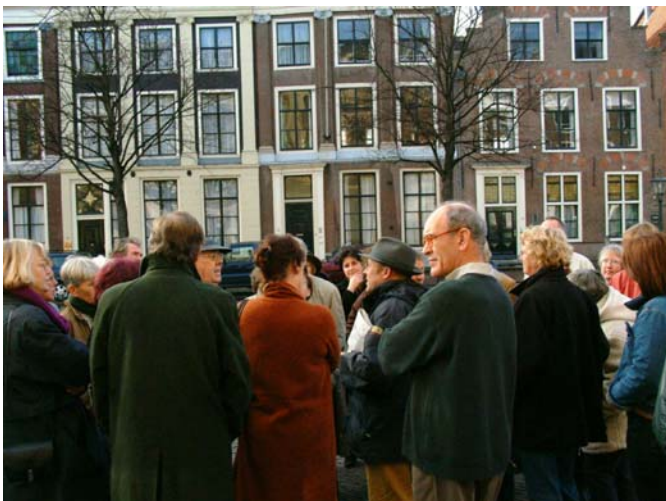
Deelnemers excursie.

De hele geschiedenis van het museum was intussen in vogelvlucht voorbijgetrokken. Enkele hoogtepunten uit dit uitvoerige en met gevoel voor details gebrachte verhaal: Allereerst de stichting in 1818 door koning Willem I, die vond dat Nederland een museum moest krijgen dat kon wedijveren met het Louvre in Parijs en het Brits museum in Londen. Dan het aantreden van de eerste directeur C. Reuven, die tussen 1820 en 1830 door zijn ijver en netwerk voor een enorme uitbreiding van de collectie zorgde. Vele antiques uit de Nederlandse kolonies, Griekenland, Egypte, Noord-Afrika, Italië en Nederland zelf vonden hun weg naar Leiden. Intussen was in 1821 de collectie, oorspronkelijk ondergebracht in het zogenaamde Hof van Zessen (naar de zes nonnen van de abdij Leeuwenhorst bij Noordwijkerhout, die in 1582 het patriciërshuis aan het Rapenburg bewoonden) verhuisd naar een nieuw museumgebouw aan de Houtstraat. Ook dit gebouw werd spoedig te klein en men dacht in die tijd zelfs aan een nieuw museum op 'de Ruïne', de