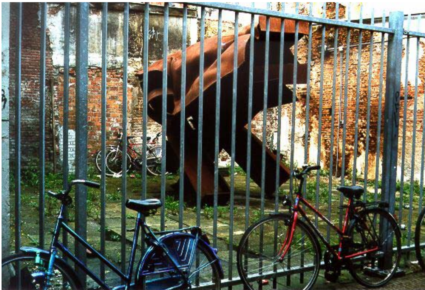
Het gat van de Mandemakerssteeg.