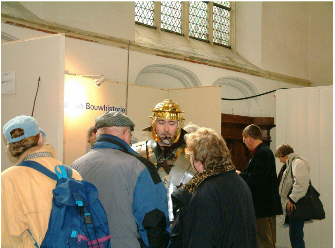
De excursie van de wijkvereniging wordt in het museum ontvangen door een Romeinse soldaat.

vooroverleg rond de organisatie daarvan. Dat individuele bewoners hun grof vuil nogal eens onaan gekondigd voor de deur zetten, merk je pas achteraf als er klachten komen. Zo mogelijk wordt in dergelijke gevallen vastgesteld wie de dader is en deze wordt daarop aangesproken. Gewoonlijk krijgt hij nog de gelegenheid om zijn afval weer binnen te halen, maar indien hij in gebreke blijft volgt een bekeuring. Nodig is dat niet want op afspraak wordt het grofvuil gratis bij u voor de deur weggehaald. Alleen voor puin geldt dat niet.