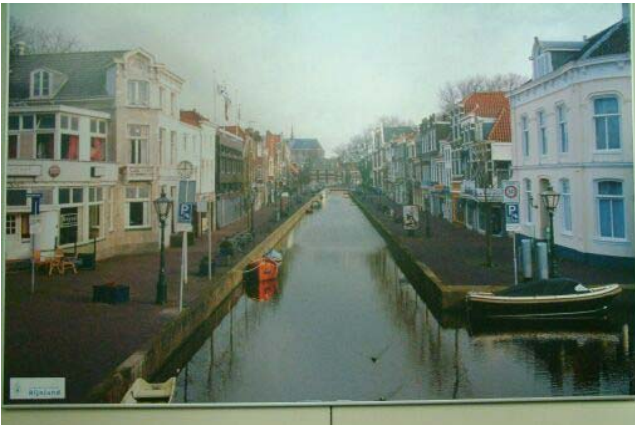
Doezagracht, trucage gemaakt ter gelegenheid van de tentoonstelling Water in de Wijk (foto ook opgenomen in gelijknamige boek).

Gelukkig hebben onze verenigingsbomen, de linde op het Pieterskerkplein, de Ostrya Japonica in de Hortus en de tulpenboom op de Jan van Houtkade het goed gehouden. Langs het Galgewater zullen in het plantseizoen 2003-2004 weer bomen komen, ter vervanging van degene die al jaren geleden zijn geroid.