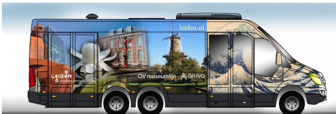
Impressie bus OV-Museumlijn

Vanaf 26 augustus 2018 gaat Arriva met de OV-Museumlijn rijden. De formele besluiten volgen de komende maanden, maar binnenkort starten we al met voorbereidingen, zodat we op tijd klaar zijn. De proef duurt een jaar. Samen met de provincie Zuid-Holland en Arriva doen we met deze lijn ervaring op met een kleinere bus. Deze proef past goed bij de ambitie van de gemeente om duurzame mobiliteit in Leiden te bevorderen.